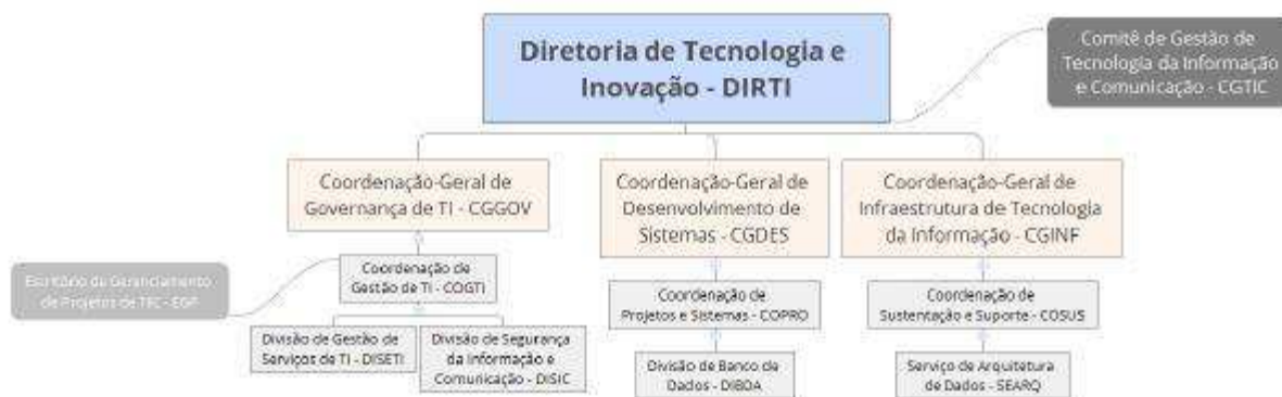
Figura 2 - Organograma da DIRT.

De acordo com a Portaria nº 629, de 3 de agosto de 2017, do Fundo Nacional de Desenvolvimento da Educação, a estrutura regimental da Diretoria de Tecnologia e Inovação do FNDE possui a seguinte configuração: