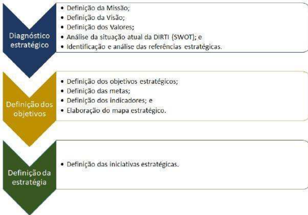
Figura 1 - Racional de Elaboração do PETIC.