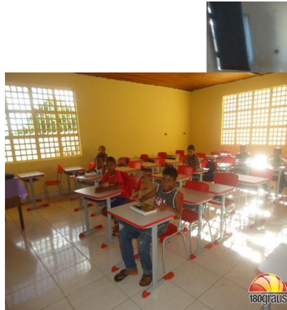
Cristalândia do Piauí (PI) – IDHM 2013: 0,573