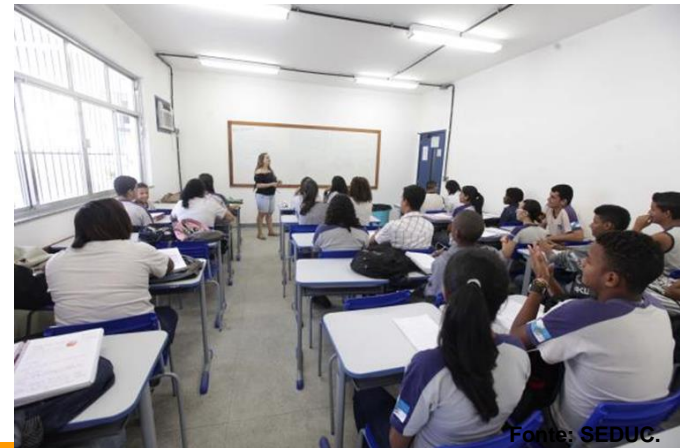
Rio de Janeiro (RJ) – IDHM 2013: 0,799