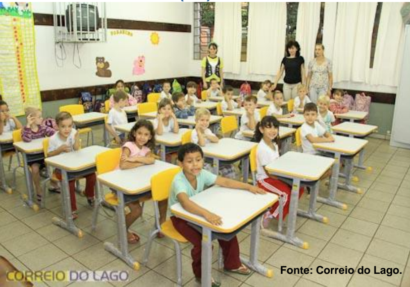
Santa Helena (SC) – IDHM 2013: 0,727