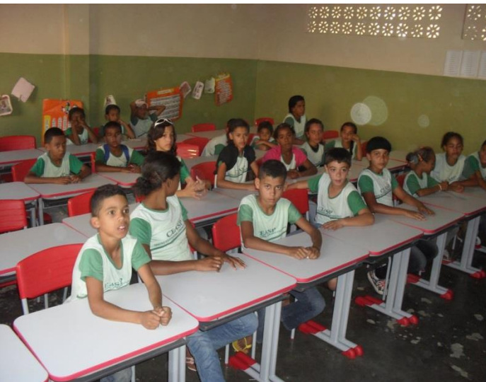
Maracás (BA) – IDHM 2013: 0,607