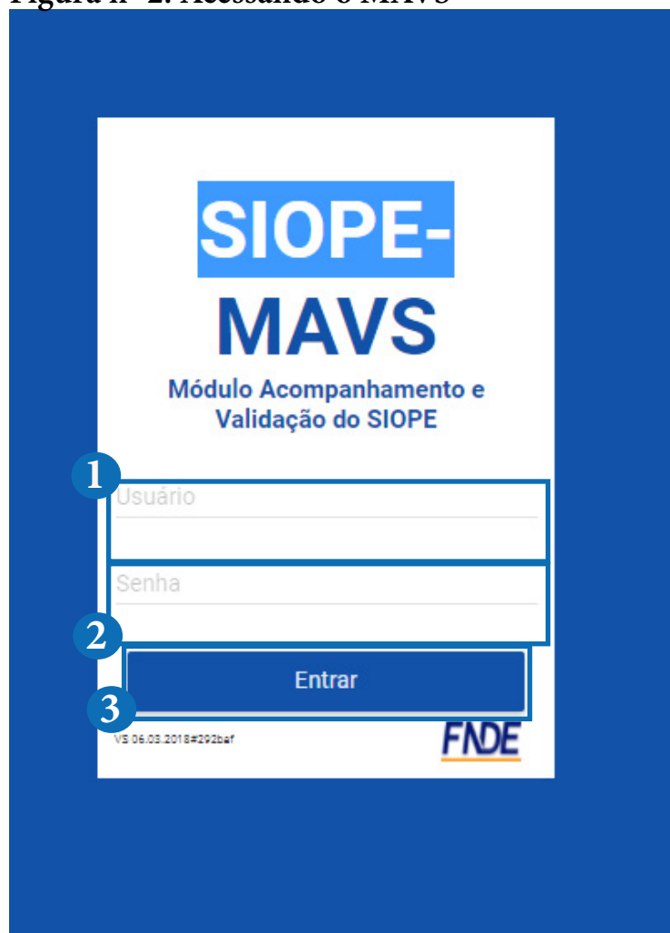
Figura nº 2: Acessando o MAVS

De posse da senha do SIGECON, o Presidente do CACS-Fundeb deve acessar o MAVS na internet e inserir no campo específico o seu CPF e a mencionada senha, conforme a figura nº 2, abaixo: