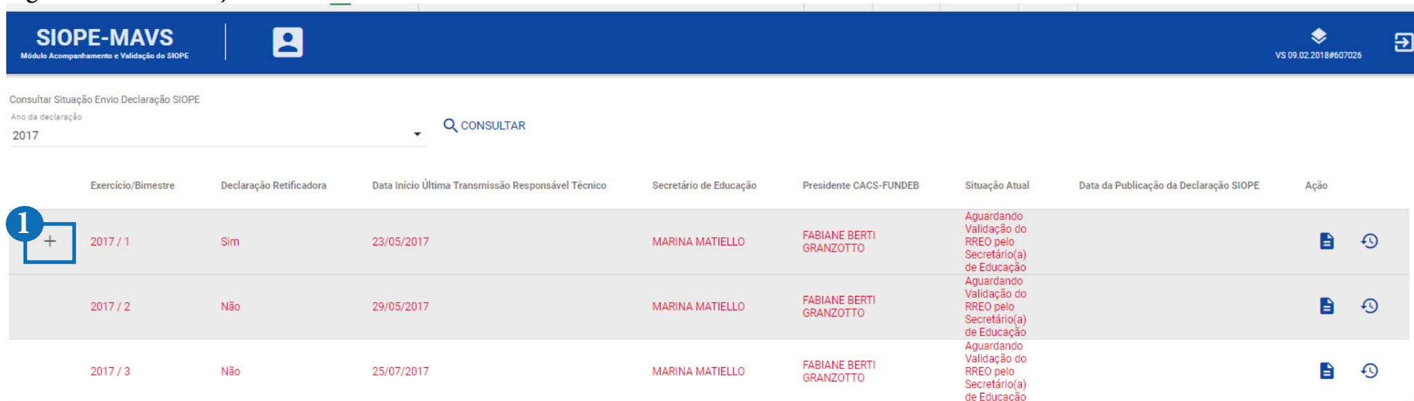
Figura nº 6: Declaração Retificadora

Quando há uma declaração retificadora, o Presidente do CACS-Fundeb deve clicar no sinal positivo (+) para abrir a linha correspondente a essa declaração, de forma que possa então visualizar o respectivo relatório “Demonstrativo do Fundeb” com as informações retificadas. Caso concorde com as informações declaradas pelo ente federado, no que se refere às receitas e despesas realizadas com recursos do Fundeb retificadas, para o período selecionado, irá clicar em “confirmar a informação” e os dados retificados serão publicados no sistema SIOPE, em substituição aos dados anteriormente publicados. Esse processo deverá ocorrer todas as vezes que o ente federado transmitir ao SIOPE a Declaração Retificadora. Na figura nº 6 abaixo, está demonstrado onde localizar as declarações retificadoras: